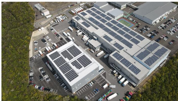
日本アクセス春日井物流センター 空撮写真

アイグリッドはクリーンでサステイナブルなエネルギー社会を実現し、エネルギーを超えた価値を提供するライフサービスプロバイダーとなり、再エネ利用の最大化を推進し脱炭素化社会の実現に貢献してまいります。